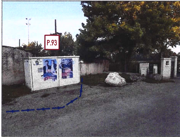
LECTOURE - STADE - Av. de la Gare - Section CN - Parcelle 61