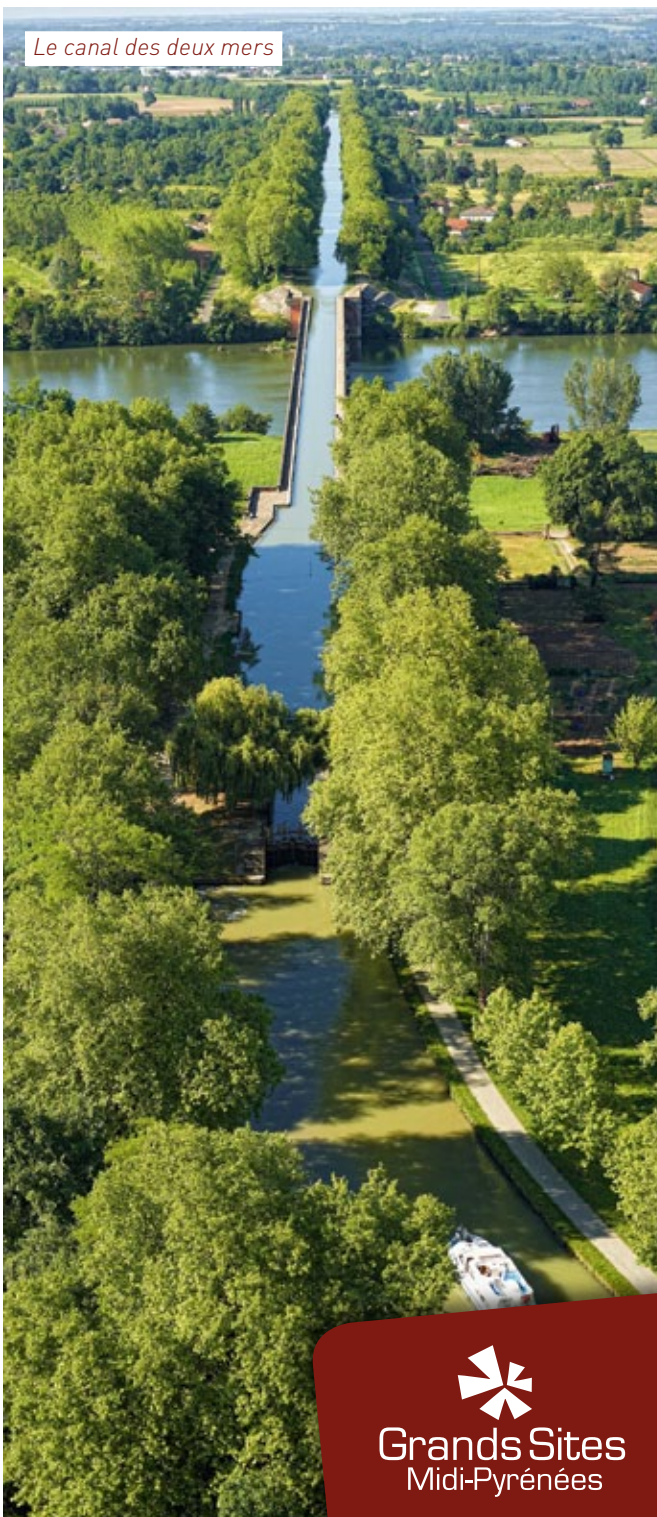
Le canal des deux mers

Légende : L : lundi, M : mardi, Me : mercredi, J : jeudi, V : vendredi, S : samedi, D et F : dimanche et fêtes. Jours fériés 2015, se reporter aux horaires du dimanche (1 er janvier, 6 avril, 1 er mai, 8 mai, 14 mai, 25 mai, 14 juillet, 15 août, 1 er novembre, 11 novembre et 25 décembre).